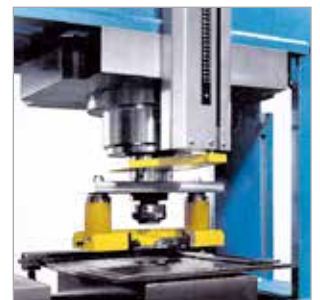
Stanzwerkzeug für Durchmesser von 6 mm bis 40 mm mit elastischem Niederhalter mit Verformungsschutz