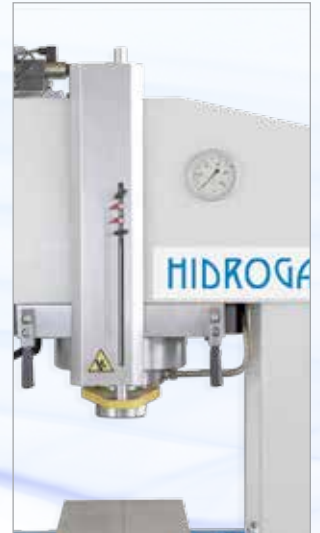
Detailansicht des Zylinders