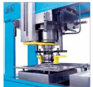
Équipement de poinçonnage pour diamètres de 6 mm à 160 mm.