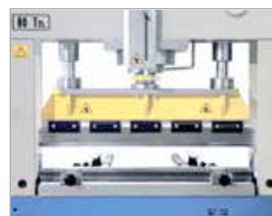
Équipement de pliage d'une longueur de 1020 mm