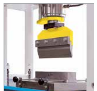
Équipement de pliage d'une longueur de 415 mm