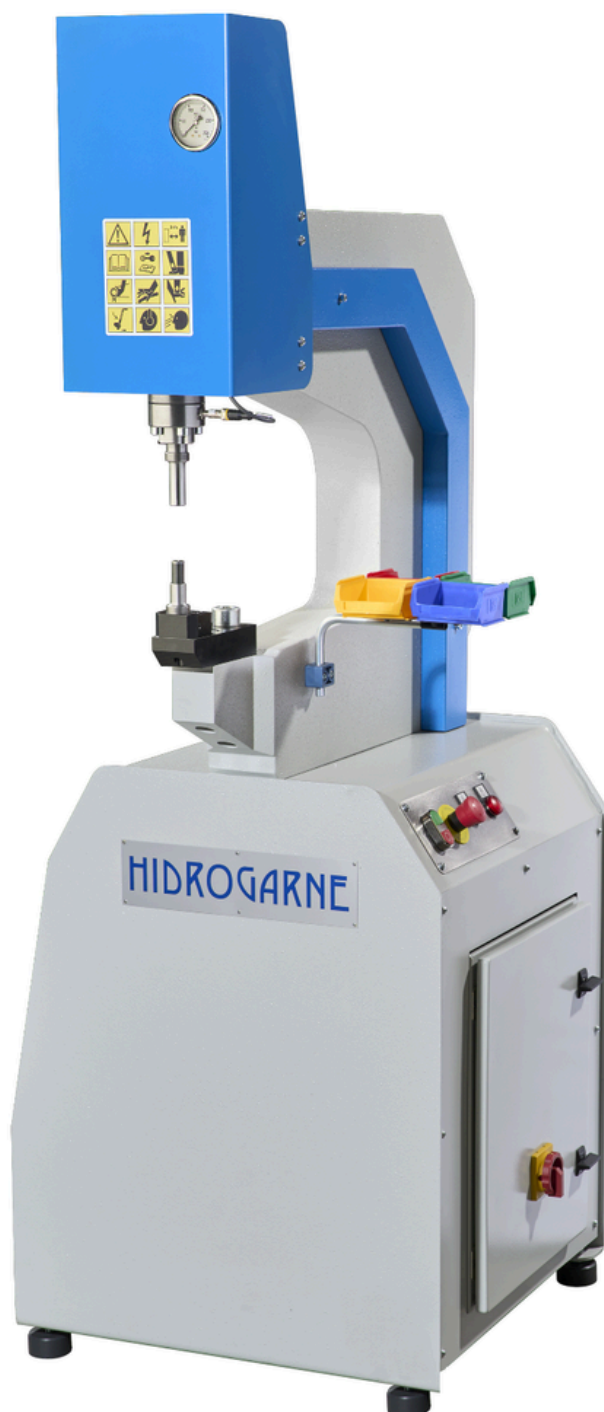
Modelo 60 analógico estándar de 6 tn.

Incorporan doble sistema de seguridad integrado , accionamiento mediante doble pedal eléctrico de seguridad, regulación manual de presión y regulación de la carrera de retorno del punzón , permitiendo un ajuste rápido y eficaz del proceso de inserción.