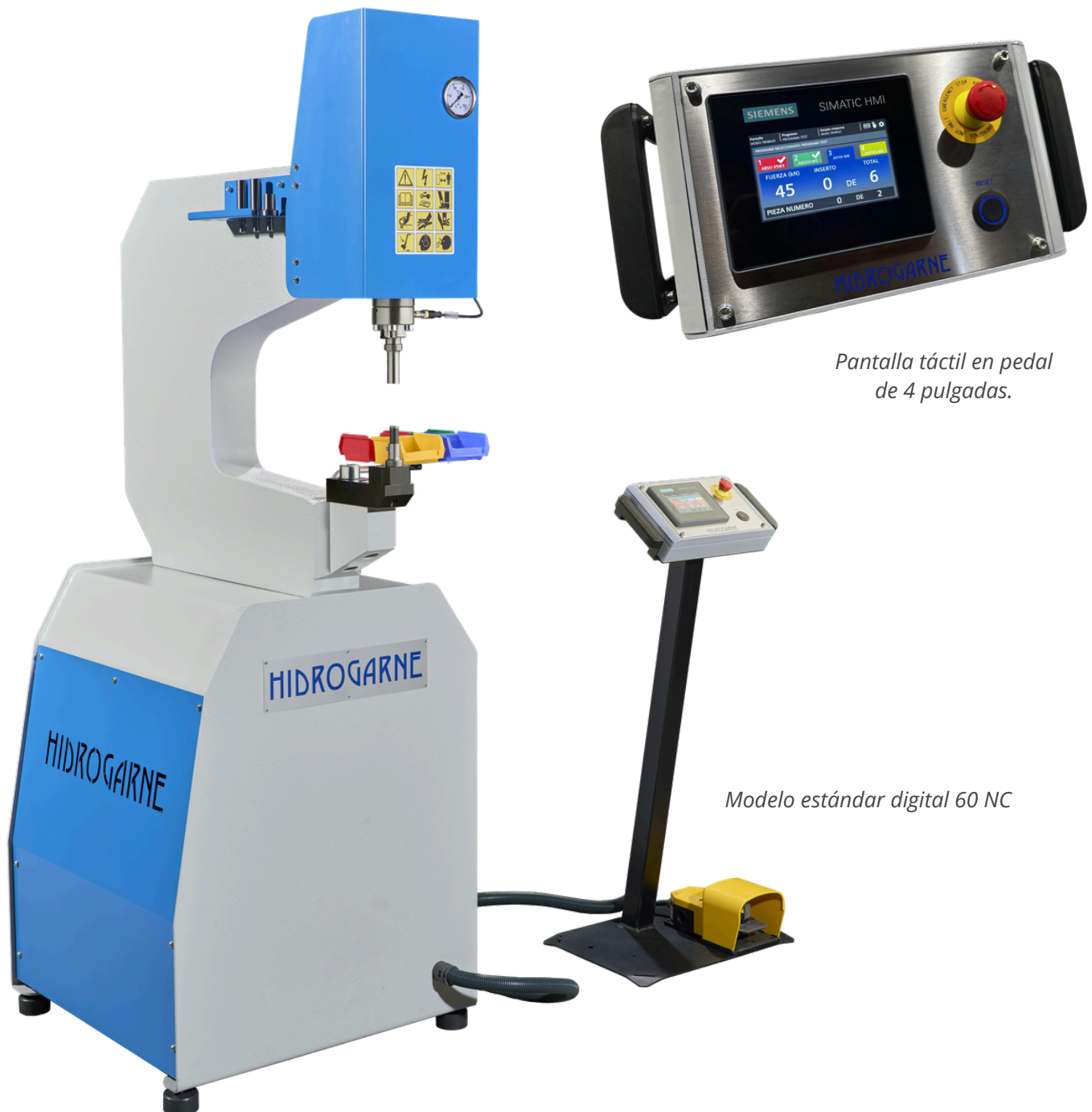
Pantalla táctil en pedal de 4 pulgadas.

Disponen de doble sistema de seguridad integrado con sensor de distancia en el porta punzón y accionamiento mediante doble pedal eléctrico de seguridad.